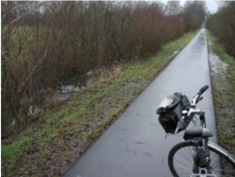
Wunderschöner Weg zwischen Berge und Ribbeck (hier im Winter)