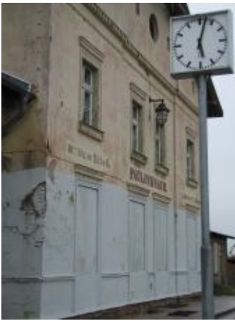
Das einstmalige schöne Bahnhofsgebäude in Paulinenaue ist in einem schlimmen Zustand