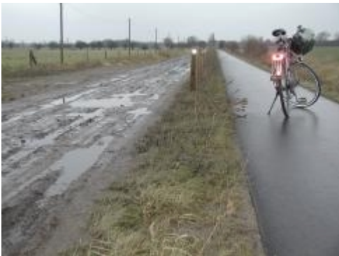
Links oder Rechts? Zwischen Ribbeck und Marienhof