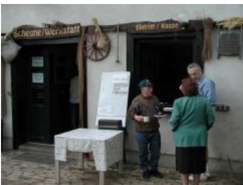
Ein Besuch auf dem Marienhof lohnt immer